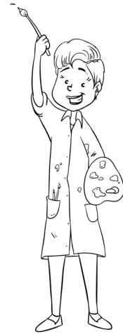
Elle est créative.