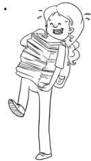
Elle est studieuse.