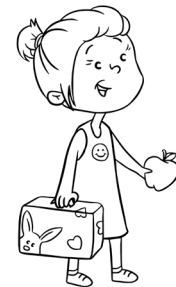
Elle est douce.